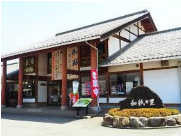
体験:紙漉き(東秩父村 和紙の里)