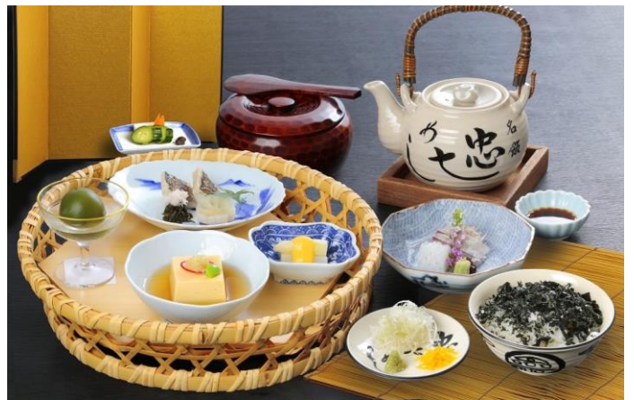
食事:割烹旅館 二葉(忠七めし)